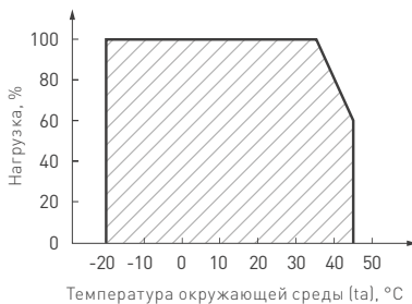
Рис. 2. Максимальная допустимая нагрузка, % от мощности источника.