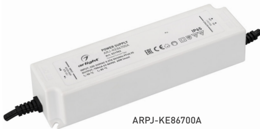
ARPJ-KE86700A ARPJ-KE571050A ARPJ-KE421400A