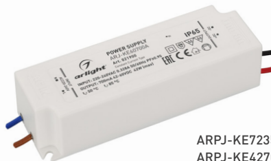
ARPJ-KE72350A ARPJ-KE42700A ARPJ-KE60700A ARPJ-KE401050A